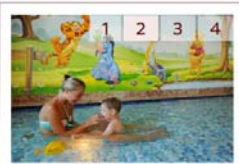
Baby- und Kleinkinderwochen