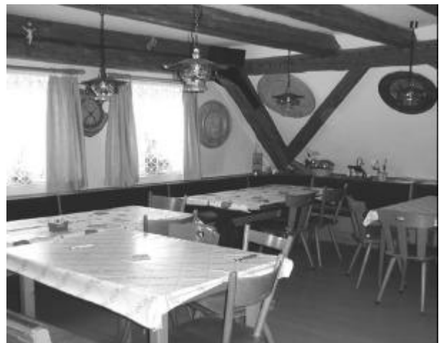
Aufenthaltsraum der Schützen.

Der Schützenverein Wallenhausen e. V. besteht seit 1927 und ist in der Dorfgemeinschaft Wallenhausen e.V. einer von sieben Vereinen. Er ist dem Bayerischen Sportschützenbund und damit mittelbar auch dem Deutschen Schützenbund angegliedert. In unserer Satzung steht als oberstes Ziel, die Gemeinschaft und Kameradschaft der Mitglieder im Verein aber auch nach außen zu fördern. Hierzu halten wir in den Wintermonaten von Oktober bis Mai Vereins- und Trainingsschießen mit Sportwaffen in unserem neuen Schützenheim „Alte Schule“ ab. Der Nachwuchs wird dabei unter Aufsicht der Jugendausbilder in verschiedenen Techniken der Schießausbildung wie z. B. Konzentrations-, Ziel- und Atemtechniken unterrichtet.