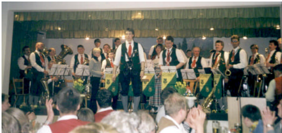
Die Schützenkapelle beim Frühjahrskonzert 2000