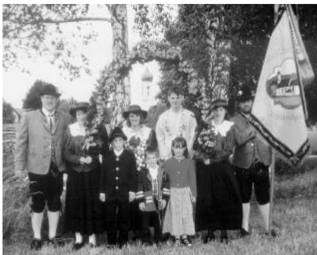
Schützenkönigin 2000 Jungschützenkönig 2000

Soweit zur Kurzinfo des Vereins. Wenn Sie jedoch mehr über den Schützenverein Wallenhausen e. V. erfahren wollen, so laden wir Sie gern am 05.11.2000 ab 15:00 Uhr in die „Alte Schule“ zu einem allgemeinen INFO-Tag mit weiteren Ausführungen ein.