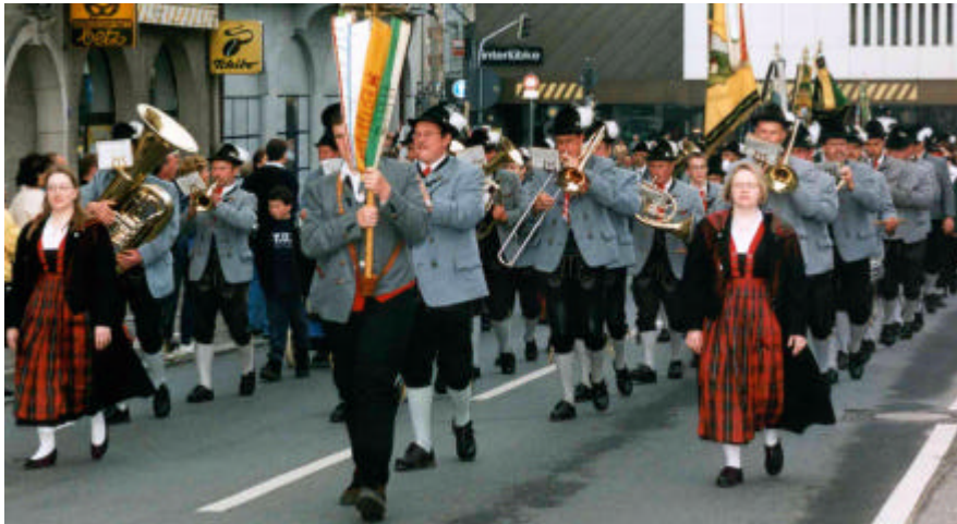
Die Schützenkapelle beim Deutschen Schützenfest in Ulm

Bierabendgruppen gehören ebenso zu unseren Aufgaben wie die Gestaltung von Festakten dörflicher und auswärtiger Vereine.